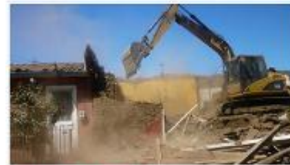
Demolición ilegal en Cuernavaca